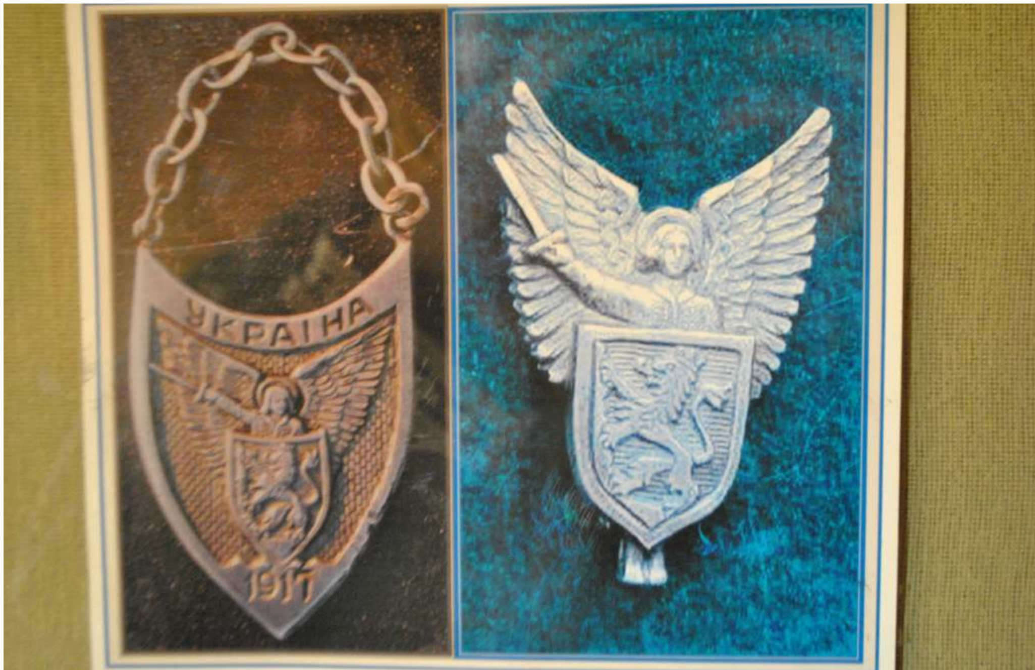
Експозиція вагону-музею злуки УНР та ЗУНР, м. Фастів, 08 березня 2014 року.