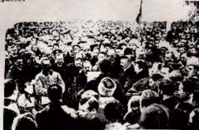
Відчитання манифесту З'єднання Українських Земель в Українську Народну Республіку 22 січня 1919 р. в Києві

Проголошення СВ'ЯДНАННЯ УКРАЇНСЬКИХ ЗЕМЕЛЬ відбулось 22 січня 1919 року, тобто різно через рік, після проголошення самостійності України.