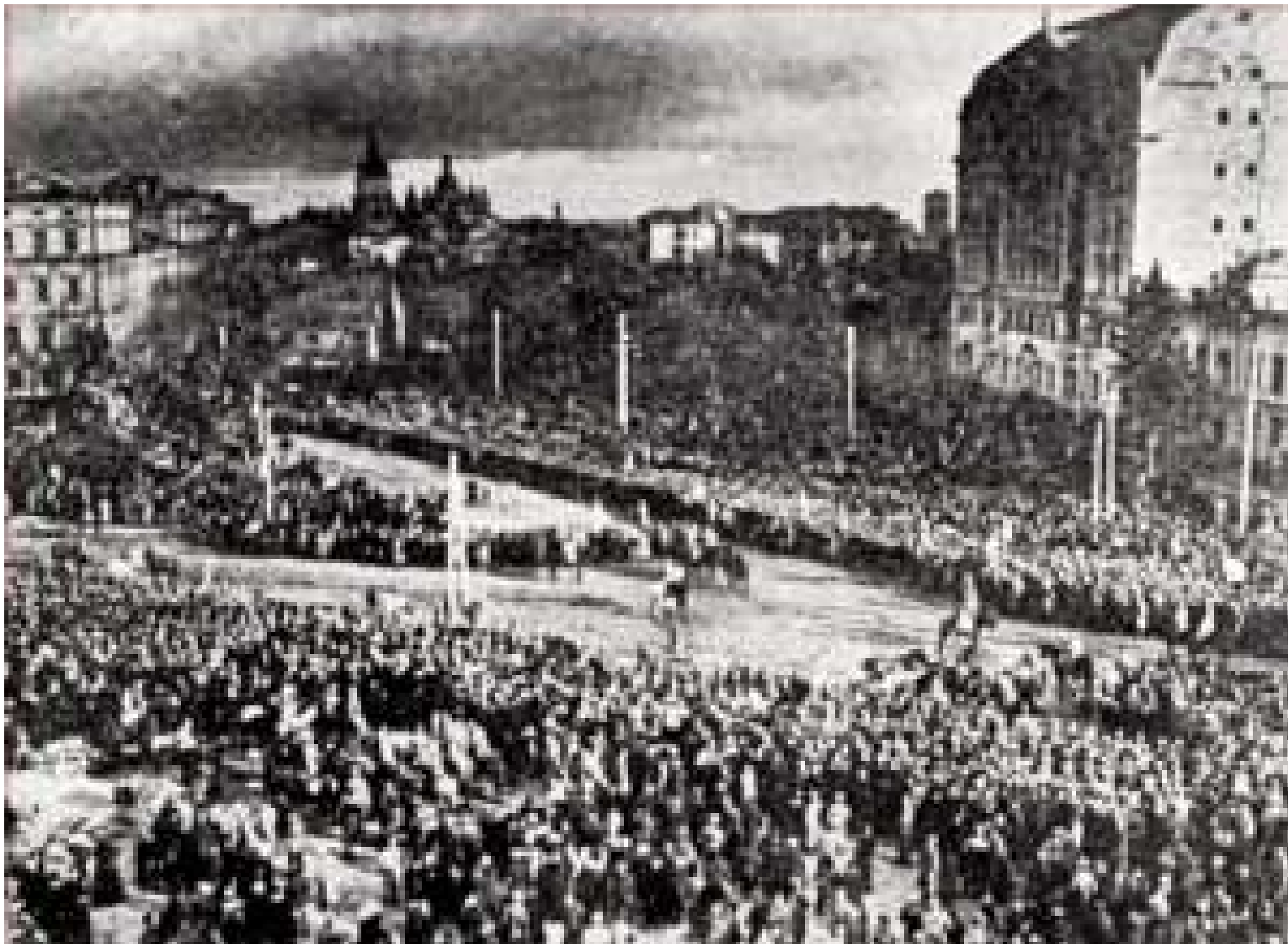
Мітинг на Софіївській площі з нагоди проголошення Акта злуки Української Народної Республіки та Західно-Української Народної Республіки. Київ. 22 січня 1919 рік.